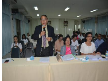
ประชุมขับเคลื่อนปรับปรุงเว็บไซต์ครั้งที่ ๑ ๒๘ มีนาคม ๒๕๖๒