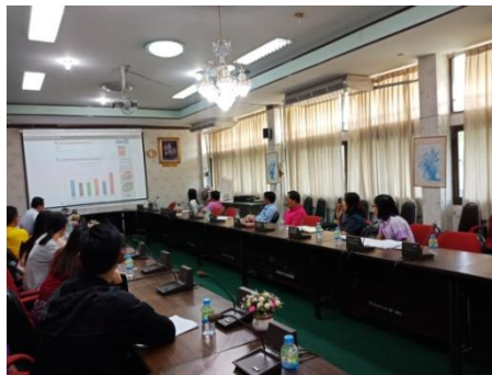
ประชุมขับเคลื่อนปรับปรุงเว็บไซต์ ครั้งที่ ๒ วันที่ ๒๒ เมษายน ๒๕๖๒