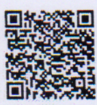
ประกาศกระทรวงฯ