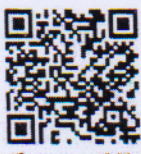
คู่มือและแบบปฏิบัติงาน

อนึ่ง สำนักงานปลัดกระทรวงศึกษาธิการ ได้ดำเนินงานจัดทำสื่อ Infographic “แนวทางการจัดการศึกษาให้แก่เด็กนักเรียน นักศึกษาที่ไม่มีหลักฐานทะเบียนราษฎรหรือไม่มีสัญชาติไทย” เพื่อใช้เป็นแนวทางและสร้างความเข้าใจในการขับเคลื่อนการจัดการศึกษา และแก้ไขปัญหาสถานะทะเบียนราษฎรของเด็กนักเรียน ที่มีเลขประจำตัวขึ้นต้นด้วยตัวอักษร G รายละเอียดดัง QR Code ด้านล่าง