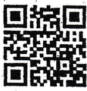
มติคณะรัฐมนตรี (๓ ก.ค. ๖๑)