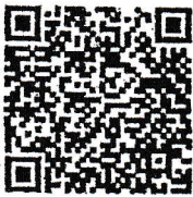
พระบรมฉายาลักษณ์